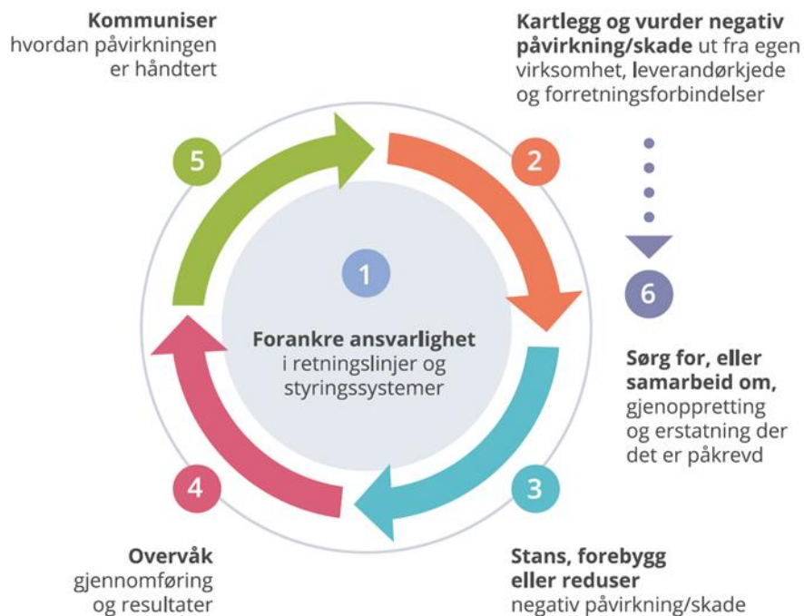
Figur 2 Aktsomhetsvurdering